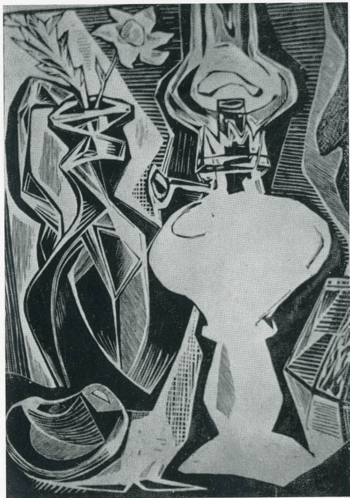
Fig. 6. E. Papadimitriou, Fotogenlampa. Träsnitt.