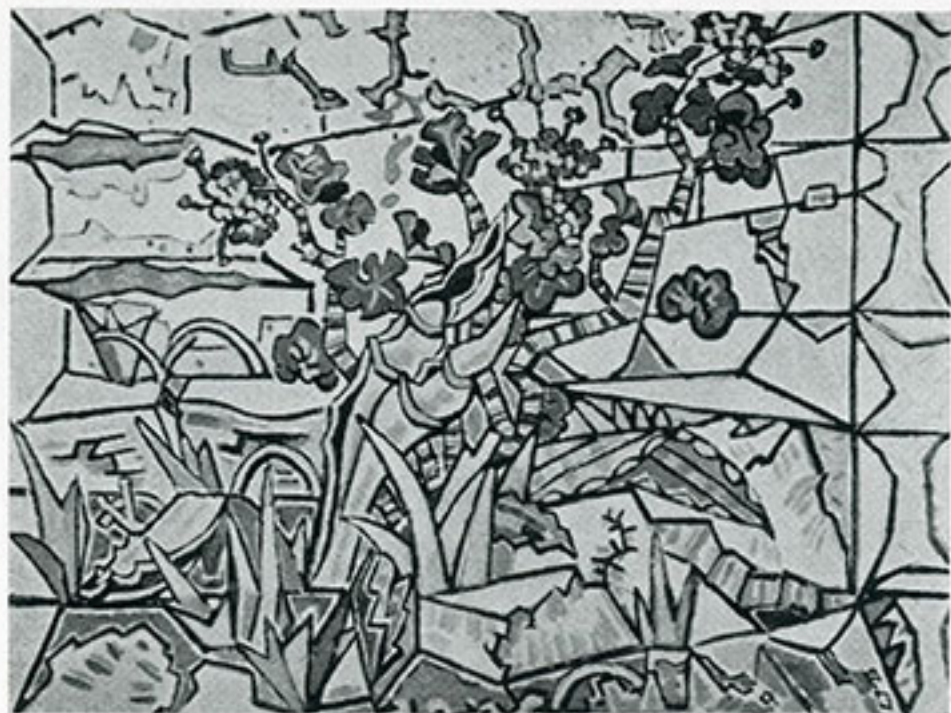
Fig. 2. N. Hatzhikyriakos-Ghikas, Geranium. Oljemålning.