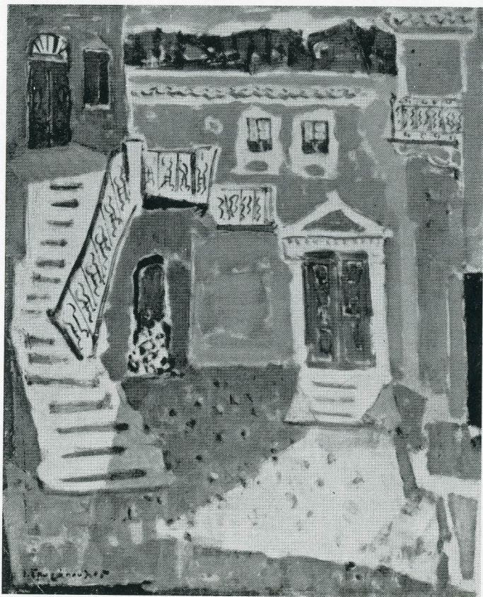
Fig. 4. J. Spyropoulos, Stadsbild från Hydra. Oljemålning.