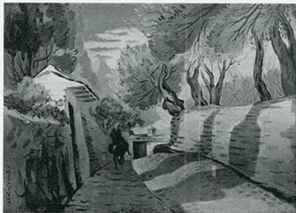
Fig. 1. A. Asteriades, Landsväg. Oljemålning.